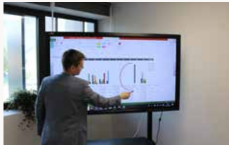
Tableau interactif Easypitch®