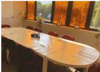
Salle Belle Étoile